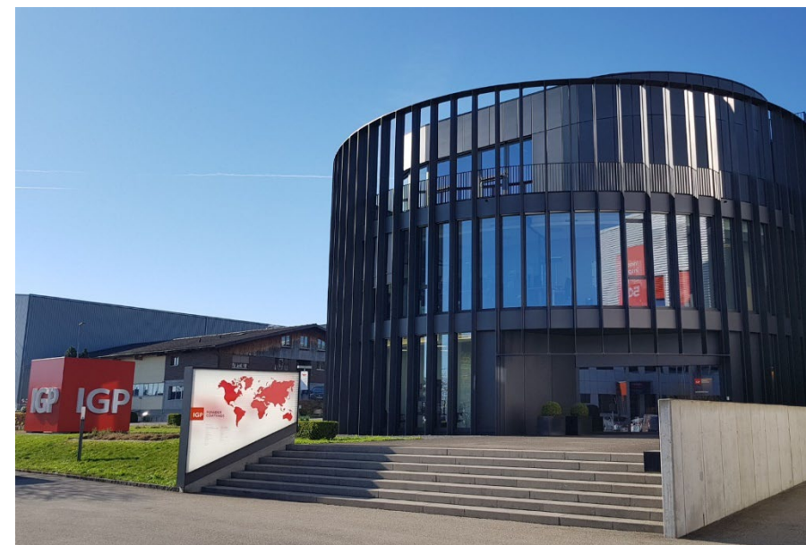
IGP Pulvertechnik AG, Wil CH