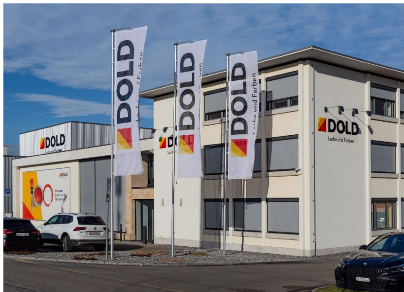
Dold AG, Wallisellen CH